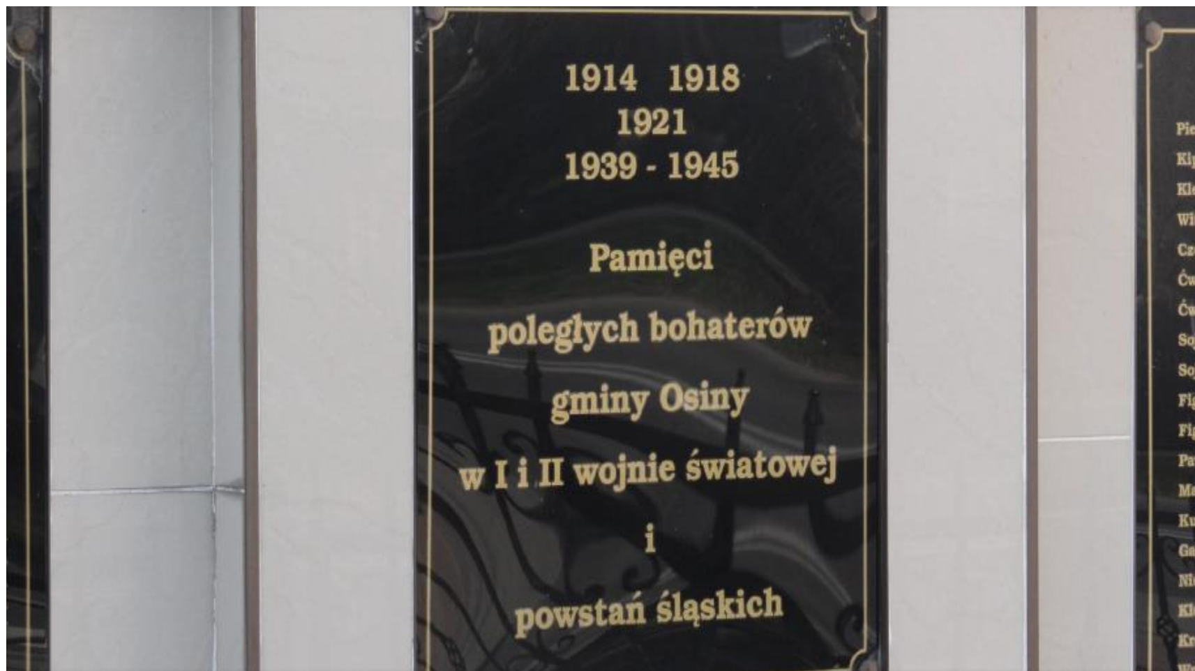
Pomnik pamięci mieszkańców Osin - ofiar I wojny światowej, powstań śląskich i II wojny światowej