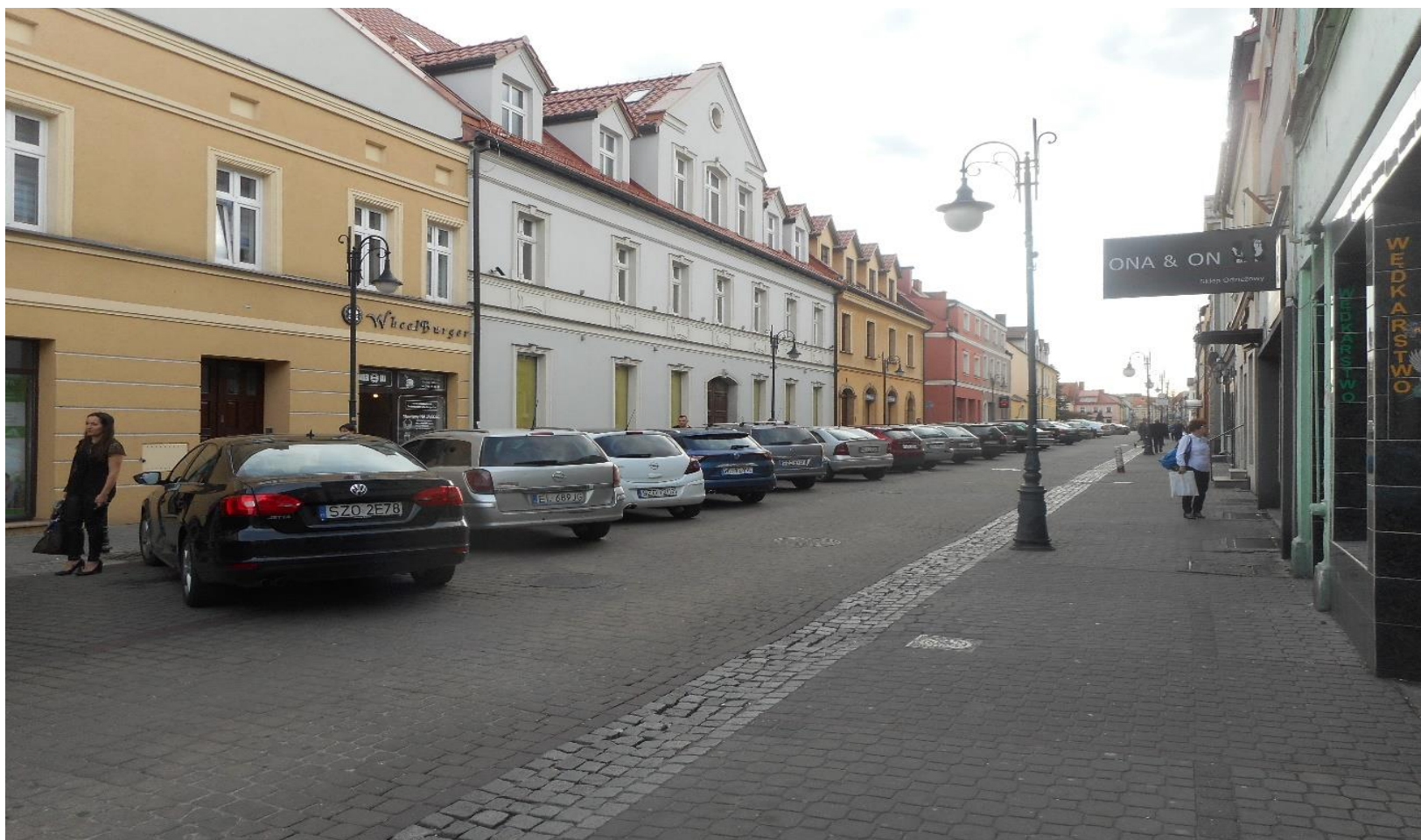
Fragment ul. Szeptyckiego