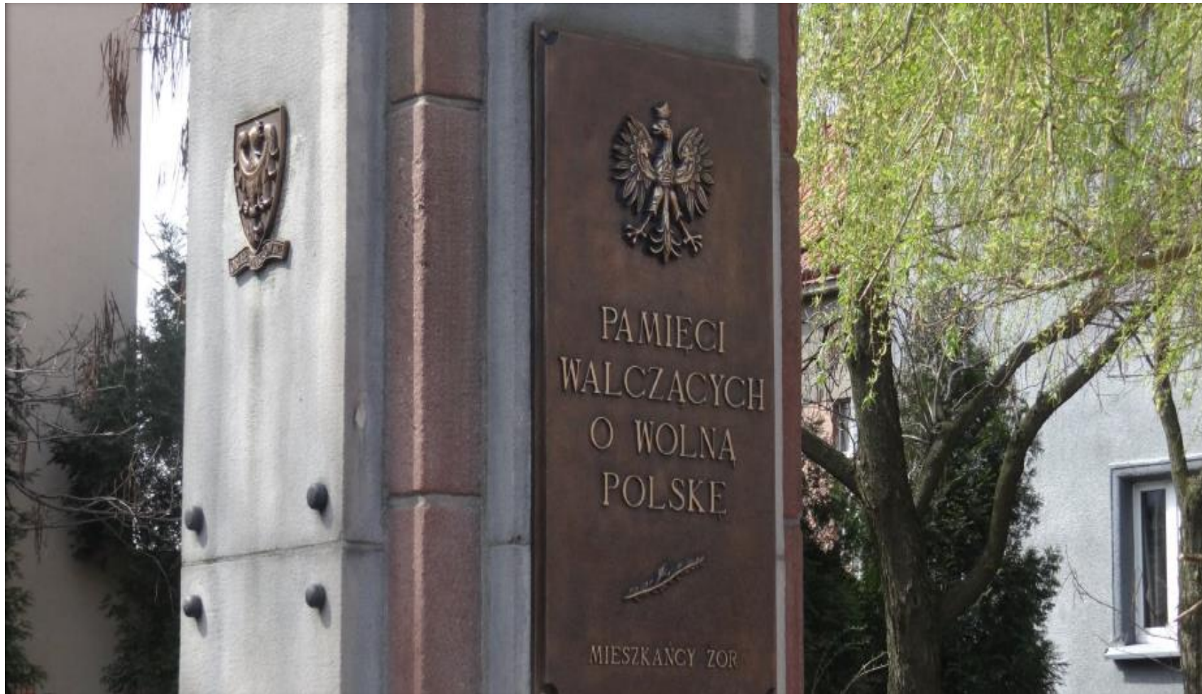
Pomnik na Placu Pamięci Narodowej (zbliżenie)