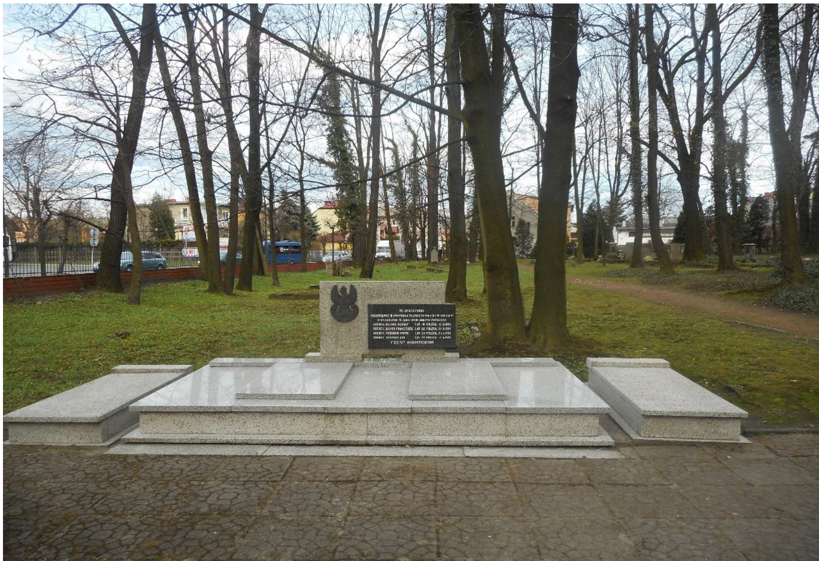
Mogiła powstańców śląskich na żorskim cmentarzu