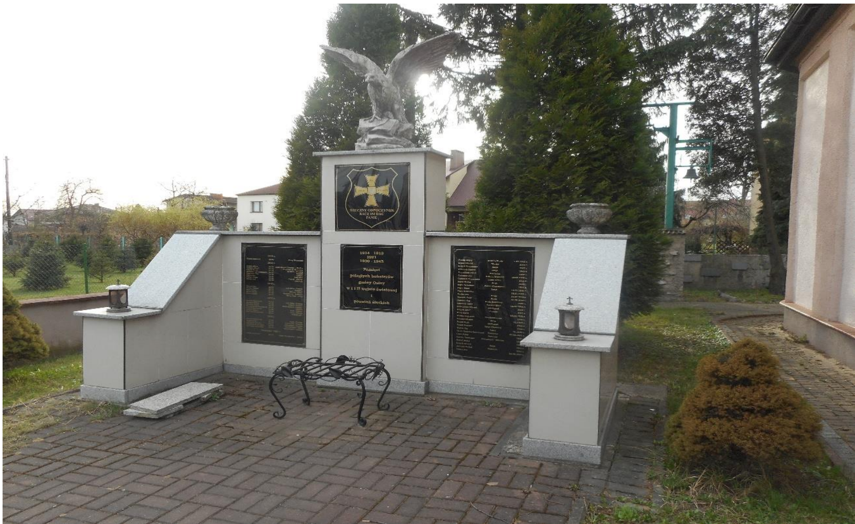
Pomnik pamięci mieszkańców Osin - ofiar I wojny światowej, powstań śląskich i II wojny światowej