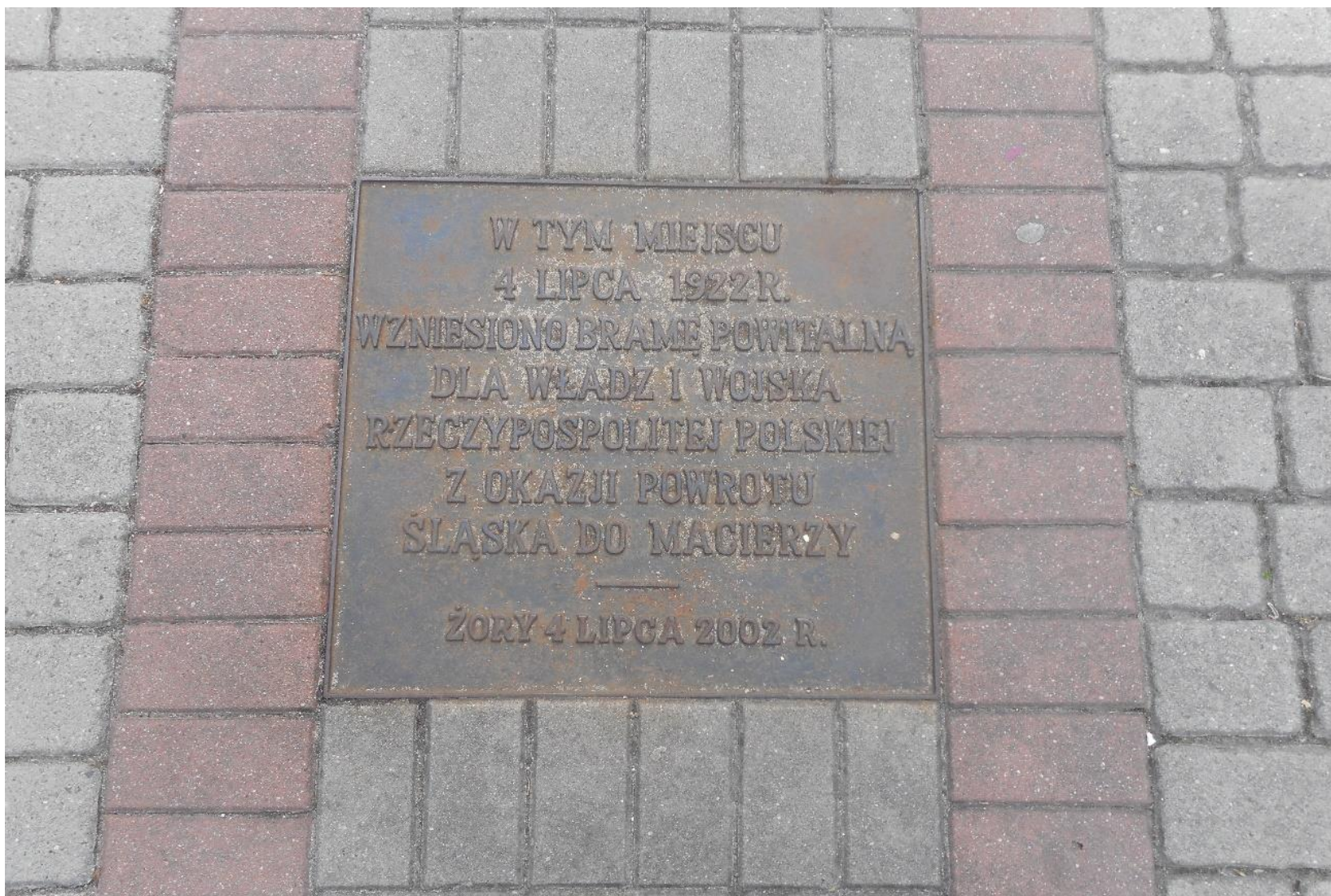
Tablica pamiątkowa, która upamiętnia bramę powitalną - ul. Klimka