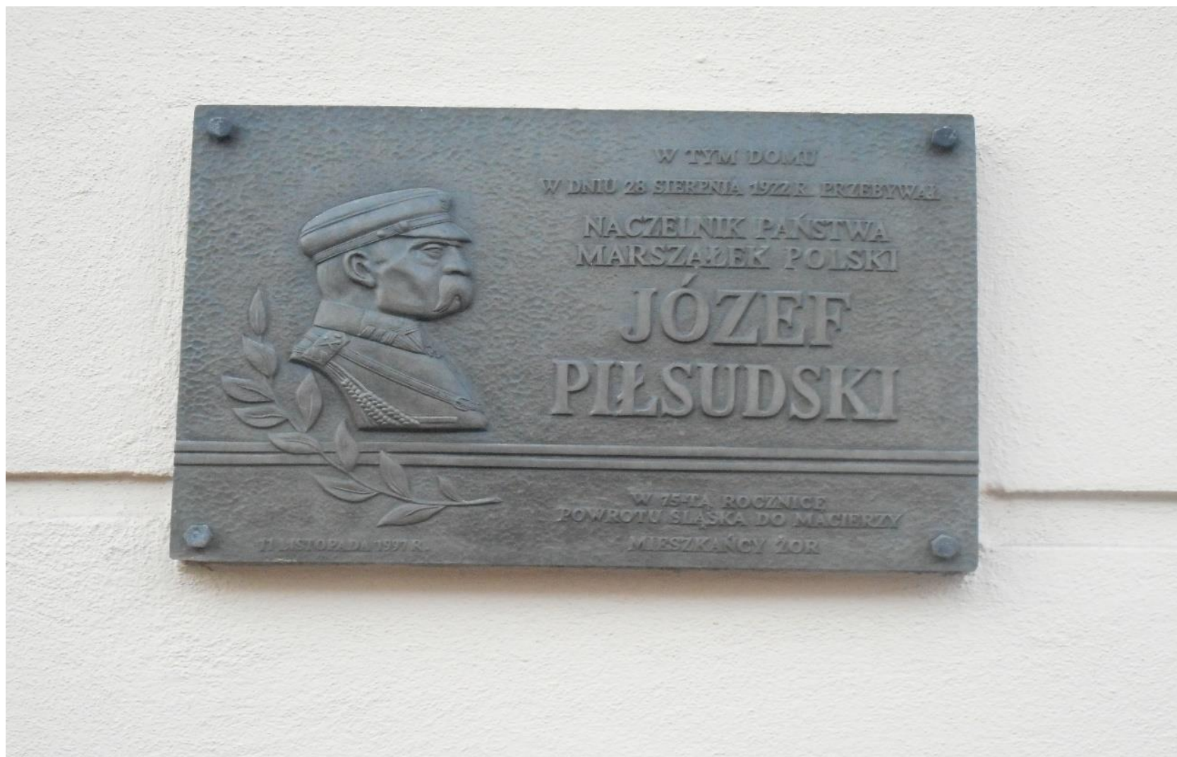
Tablica upamiętniająca wizytę w Żorach marszałka Polski Józefa Piłsudskiego w 1922 r.