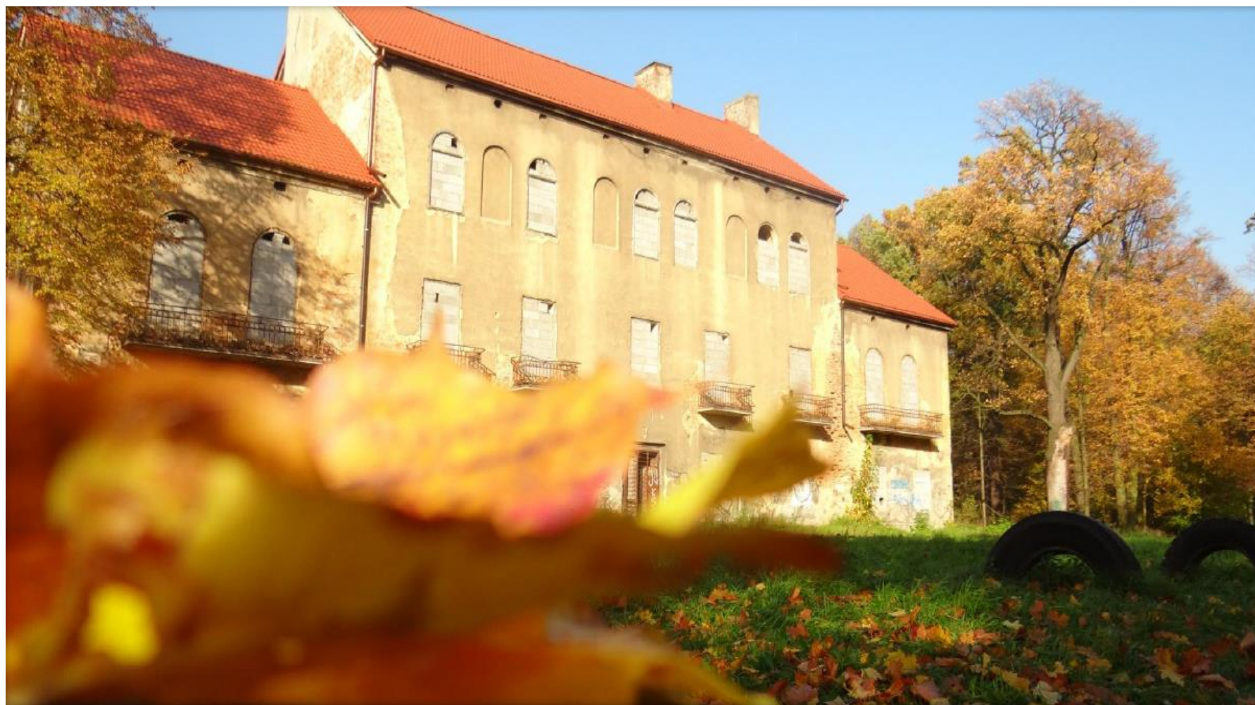
Zabytkowy pałac, dawna szkoła w Żorach Baranowiczach