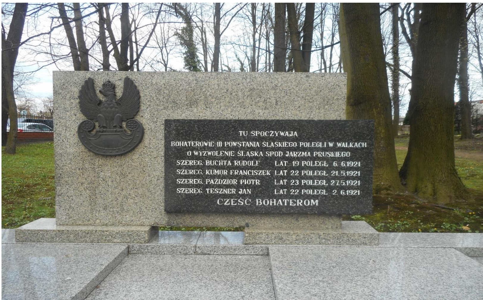
Mogiła powstańców śląskich na żorskim cmentarzu (zbliżenie)