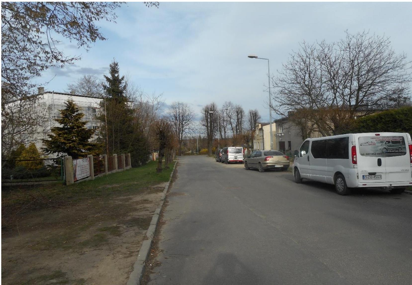
Fragment ul. Powstańców Śląskich