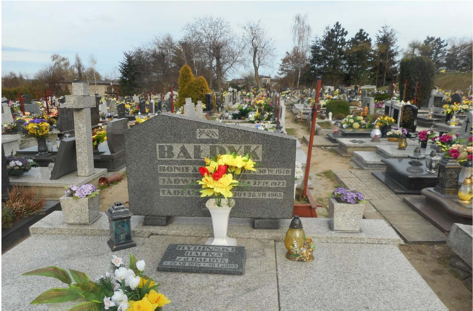
Grób rodziny, gdzie pochowano Bonifacego Bałdyka