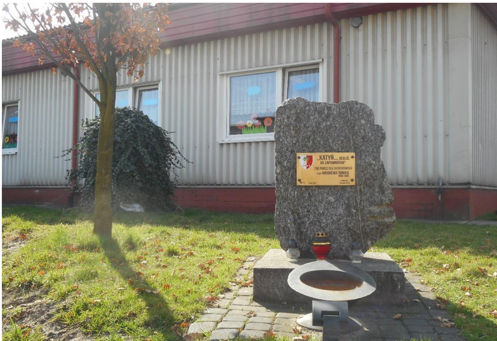
Dąb katyński zasadzony ku pamięci Nikodema Sobika (obok Szkoły Podstawowej nr 1)