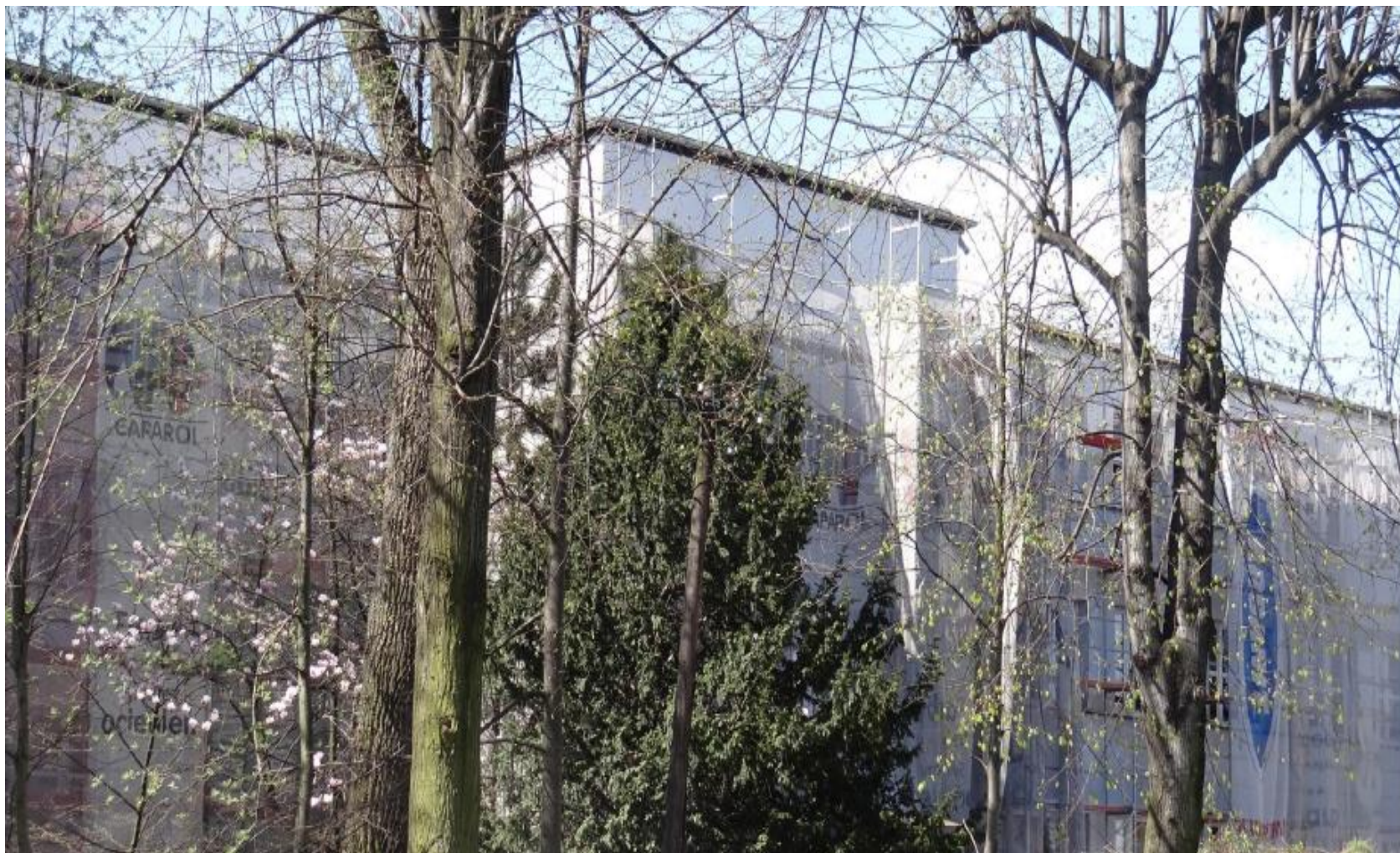
I Liceum Ogólnokształcące imienia Karola Miarki w Żorach