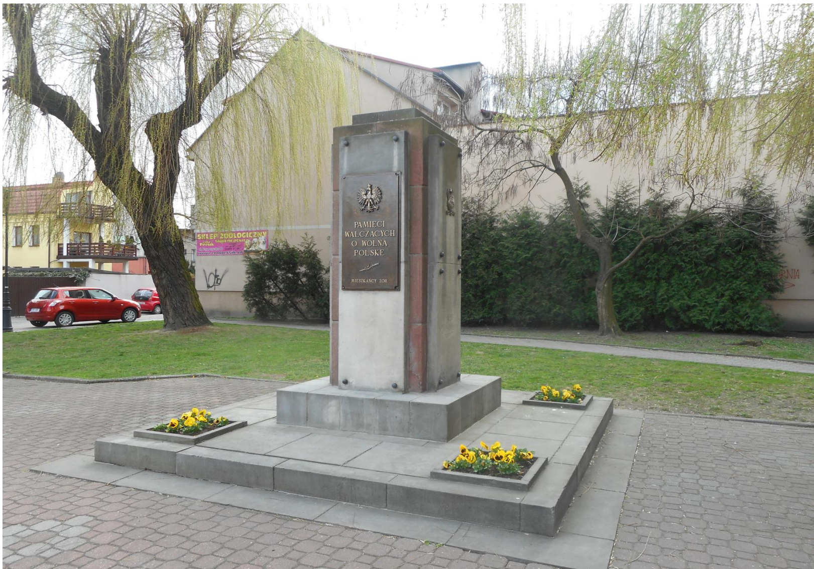
Pomnik na Placu Pamięci Narodowej