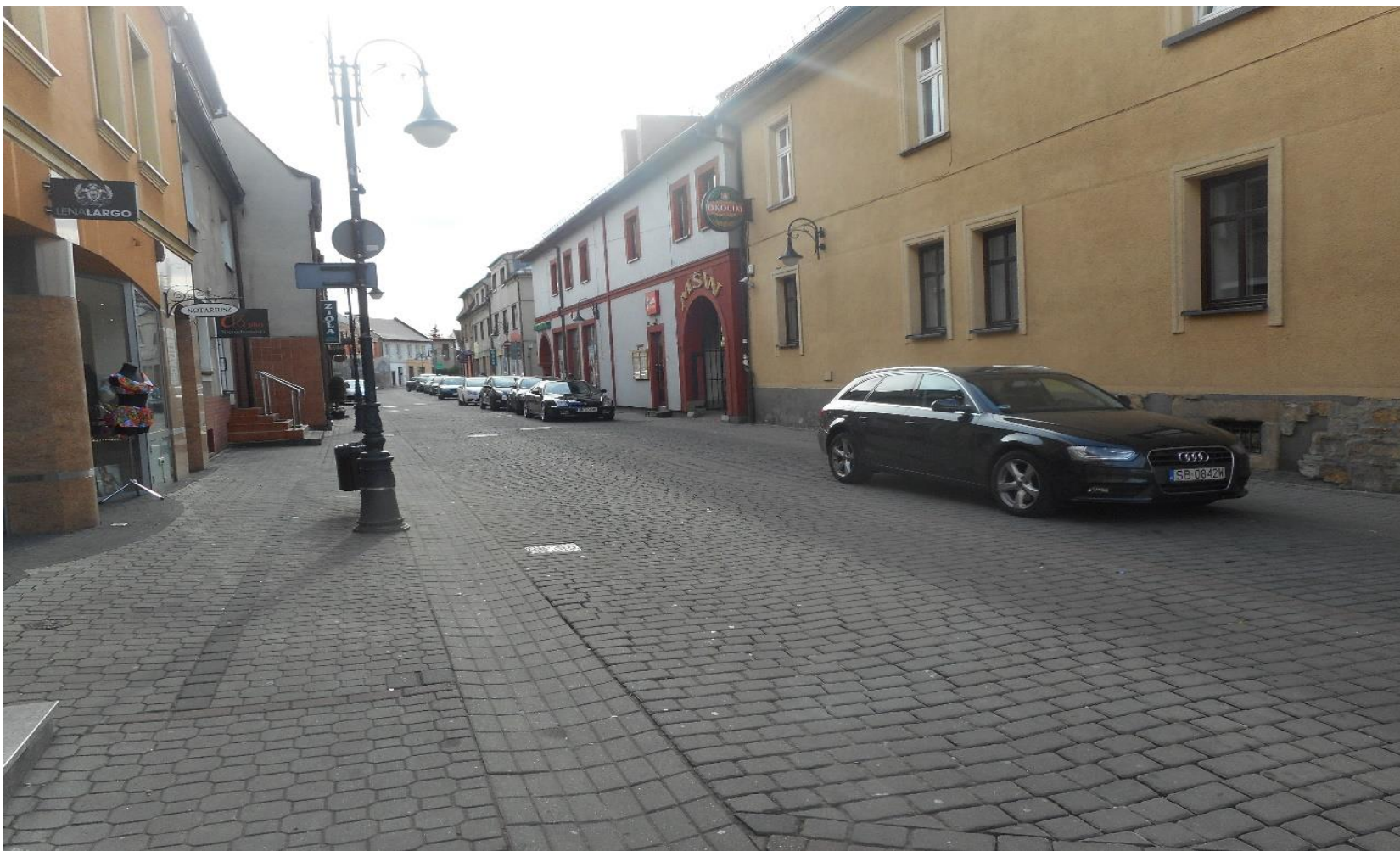
Ulica Bonifacego Bałdyka